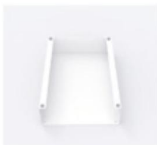
Boîte à courrier