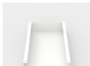
Box universel magnétique (bas)