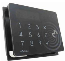
Lecteur RFID et code PIN