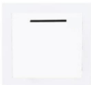
Fente à courrier