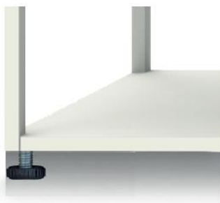
Pieds de nivellement depuis l'extérieur