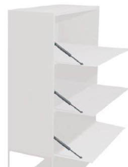
Clapet basculant vers le bas à 90° pour le deuxième casier et les suivants