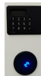
Display code PIN avec lecteur RFID séparé*