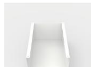
Box universel magnétique (haut)