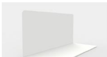
Séparation verticale magnétique