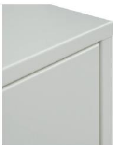
Épaisseur des parois 19 mm