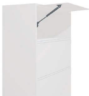
Clapet basculant vers le haut à 90° pour le premier casier