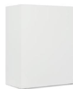
Paroi arrière lisse