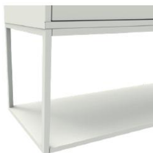
Cadre porte chaussures