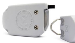
Serrure électrique avec câblage