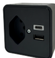
Prise électrique 230V avec deux entrées USB A/C